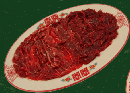
喜手切牛肉双拼 (吊龙+五花趾) 19.99